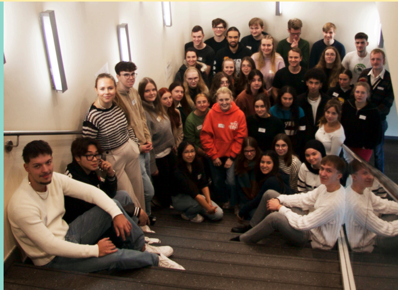
First Time 2023 Teilnehmende

„Ich habe viele neue und spannende Informationen bekommen, tolle Leute kennengelernt. Ich fühle mich jetzt viel sicherer und freue mich schon richtig aufs Studieren.“