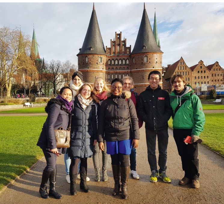
KHG on Tour, Lübeck 2018

Mi, 03.04. Meet and Eat 19.30 Uhr KHG-Abend Semesterstart in der KHG Wir starten wieder mit einem gemütlichen Abend zum Kennenlernen, Wiedersehen, Leute treffen, Essen und Trinken und (wieder) Ankommen in Bremen. Herzlich willkommen!